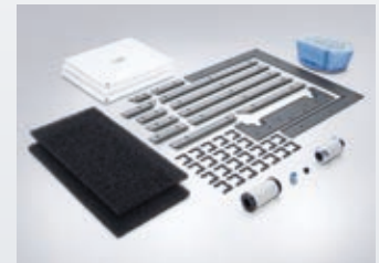
Abbildung: Wartungskit CTX 410